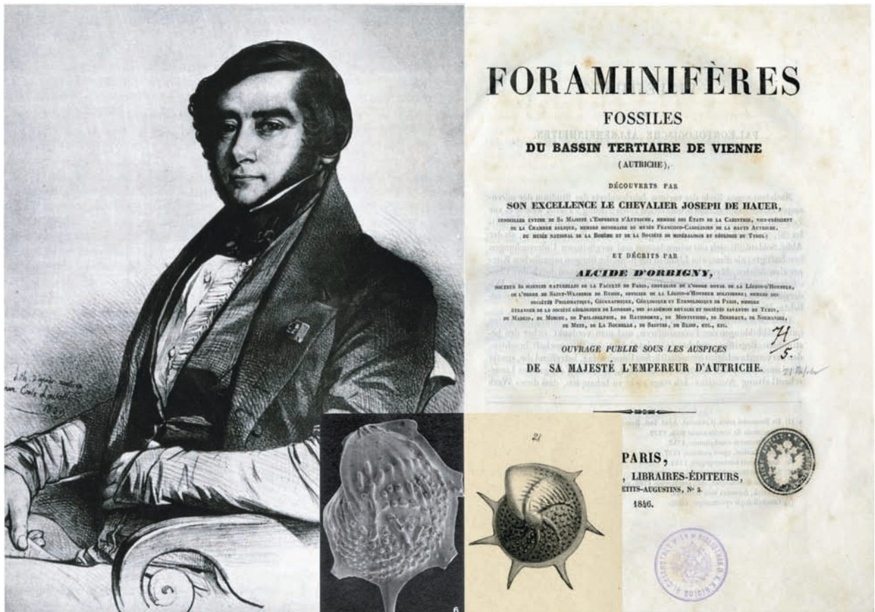
Abb. 6: Alcide d'Orbigny mit dem Titelblatt seiner Monographie über die Foraminiferen des Wiener Beckens und einem Beispiel für Originalabbildung und moderne REM-Fotographie (aus Papp & Schmid, 1985).

Sie ist stratigraphisch und regional geordnet. Erwähnenswert sind die Bestände aus dem Eozän von Monte Bolca und der Kreide von Lesina (Hvar). Weitere 80 Fossiladen lagern in der Suitensammlung, die Gesamtaufsammlungen von Kartierungen, Reisen, Expeditionen etc. enthält, z.B. Gesteine und Fossilien des Perm bis Kreide von Ampferers Kartierungen in Tirol oder Fossilien von Sturs Reise 1865 nach Deutschland und in die Schweiz. 100 Fossiladen stammen aus der ehemaligen Ausstellung „Geologie von Österreich“. In einer separaten Aufstellung sind die ca. 200 erdwissenschaftlichen Großobjekte deponiert.