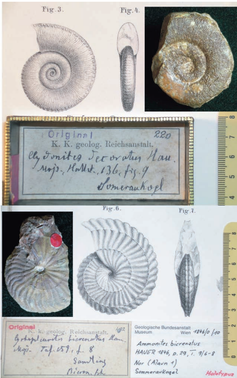
Abb. 5: Die Holotypen von Goniatites decoratus und Ammonites bicrenatus Hauer, 1846 (Trias, Hallstätter Kalk) aus der Sammlung Metternichs (wiederveröff. von Mojsicovics, 1893 (s. Originaletikett).

Belgiens, Großbritanniens und der USA gibt es einige Laden. Einzelne Stücke aus dem Karbon konnten jüngst anhand von beiliegenden Briefen aus dem Jahre 1881 durch einen spanischen Kollegen einem Fundgebiet in Spanien zugeordnet werden. Das Mesozoikum ist weniger umfangreich vertreten (400 Laden). Das Material aus dem rumänischen Kohlengbiet Anina-Steierdorf (die letzte Grube wird demnächst geschlossen) verteilt sich auf etwa