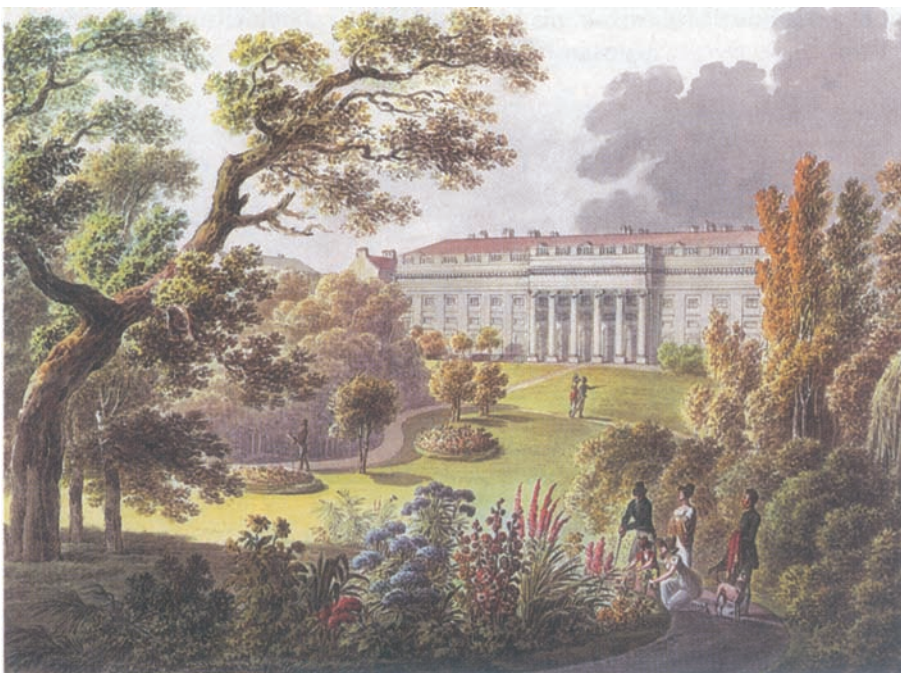
Abb. 1: Palais Rasumofsky um 1850.

1849 wurden diese etwa 40.000 Positionen enthaltenen Sammlungsbestände der neu gegründeten