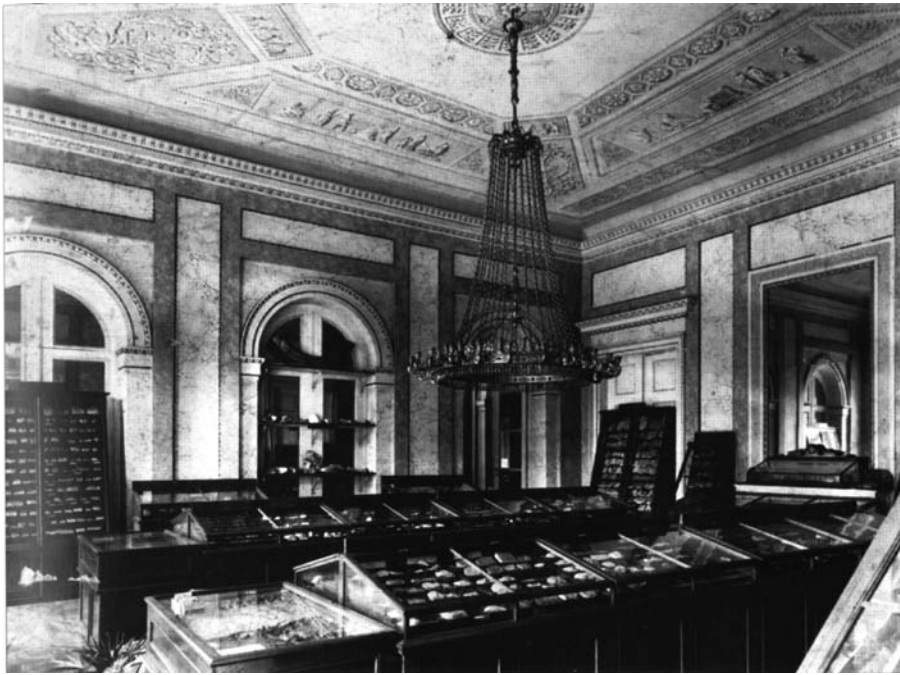
Abb. 3: Ehemalige Sammlungsanstellung im Spiegelsaal des Palais Rasumofsky um 1890 (Bibliothek GBA, Graphische Sammlung).

Der Umfang der makropaläontologischen Typen entspricht 17% der Paläontologischen Ladensammlung. Der Großteil ist inventarisiert und digital erfasst und im „ Catalogue of Palaeontological Types in Austrian Collections “ ( www.oeaw.ac.at/~oetyp/pal-home.htm ) abfragbar. In dieser von der Österreichischen Akademie der Wissenschaften finanzierten und am Naturhistorischen Museum Wien zentral verwalteten Datenbank ist die Geologische Bundesanstalt mit ca. 15.000 Datensätzen vertreten.