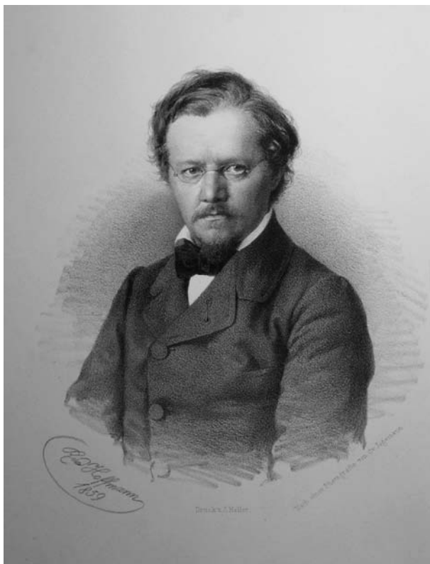
Fig. 1: Rudolf Kner (1859), lithography by Rudolf Hoffmann.

Bereits am 21.09.1843 konnte Kner bei der 21. Versammlung deutscher Naturforscher und Ärzte in Graz Kreide-Versteinerungen aus der Gegend von Lemberg vorlegen (Langer & Schrötter 1844: 118), die