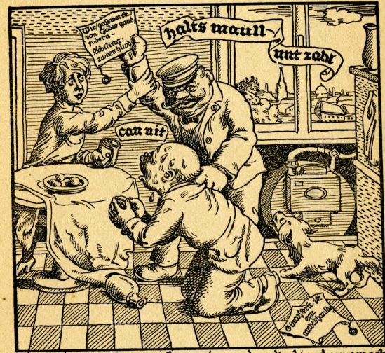
Der geestreich gab kaiser/bringet gros danksal/und ungmacht