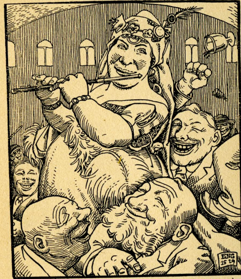
DAS ISST / DIE HOCHHERTZIG VND NOBEL WEIS / WIE JUNG UND ALT / SICH ERLVSTIGT UND WIEN 1929