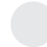
Univ.-Prof. N.N. Raumgestaltung