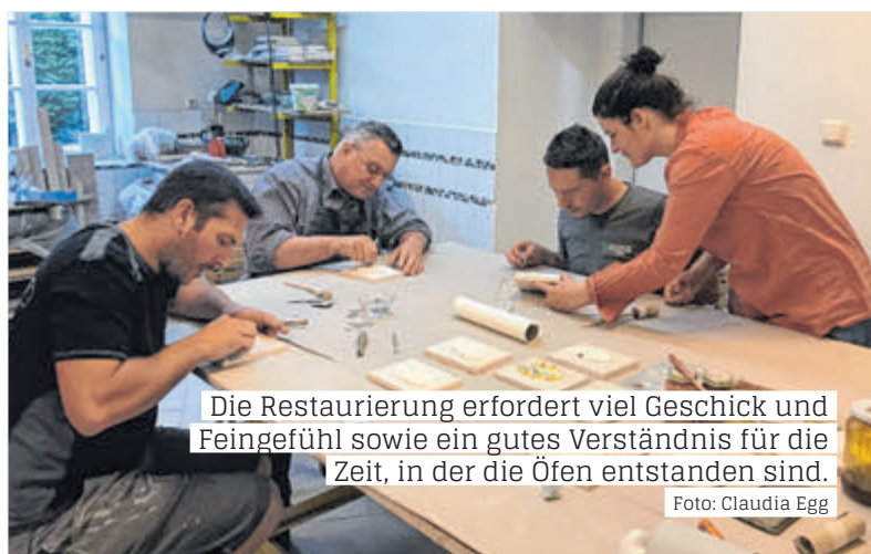
Die Restaurierung erfordert viel Geschick und Feingefühl sowie ein gutes Verständnis für die Zeit, in der die Öfen entstanden sind.