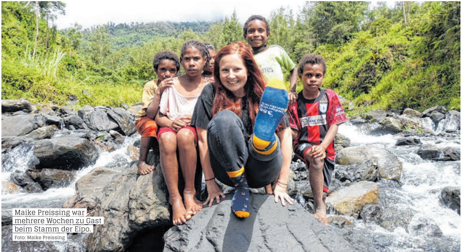
Maike Preissing war mehrere Wochen zu Gast beim Stamm der Eipo.