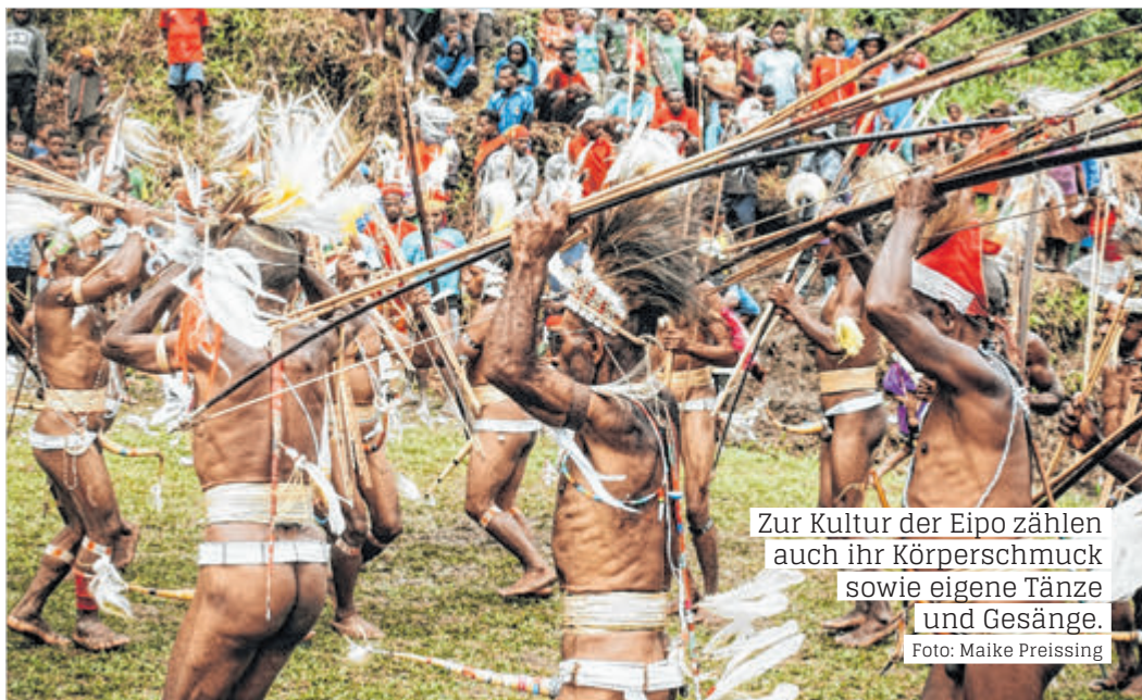
Zur Kultur der Eipo zählen auch ihr Körperschmuck sowie eigene Tänze und Gesänge.

Studieren ist viel mehr, als im Hörsaal zu sitzen, dicke Bücher zu wälzen oder Klausuren und Arbeiten zu schreiben. Studieren bedeutet immer auch, die gelernte Theorie in der Praxis zu erproben.