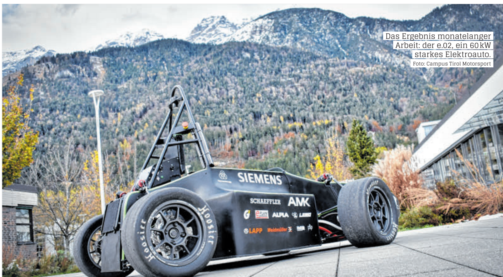
Das Ergebnis monatelanger Arbeit: der e.02, ein 60 kW starkes Elektroauto.

eva.fessler@uibk.ac.at lisa.marchl@uibk.ac.at