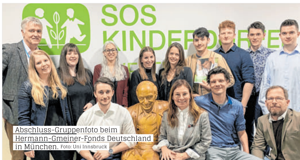
Abschluss-Gruppenfoto beim Hermann-Gmeiner-Fonds Deutschland in München.