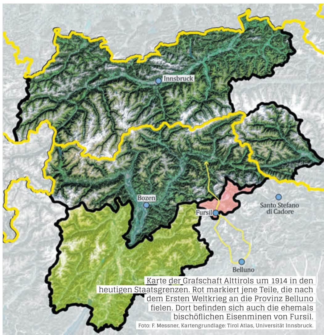
Karte der Grafschaft Altirols um 1914 in den heutigen Staatsgrenzen. Rot markiert jene Teile, die nach dem Ersten Weltkrieg an die Provinz Belluno fielen. Dort befinden sich auch die ehemals bischöflichen Eisenminen von Fursil.

Ein erstes interessantes Fundstück konnten die Wissenschaftler dazu bereits näher untersuchen: In Santo Stefano di Cadore hinter dem Kreuzbergpass haben Pilze-Sammler 1992 zufällig ein in der Erde steckendes Schwert gefunden. „Es wurde damals zwar restauriert, allerdings nicht weiter bearbeitet und im Gemeindesaal ausgestellt“, beschreibt Florian Messner. Das 120 Zentimeter