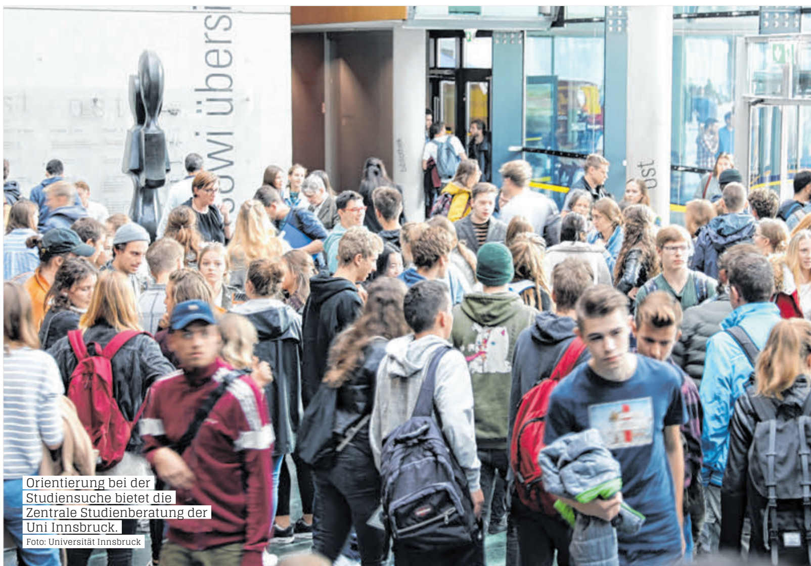
Orientierung bei der Studiensuche bietet die Zentrale Studienberatung der Uni Innsbruck.