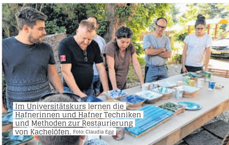
Im Universitätskurs lernen die Hafnerinnen und Hafner Techniken und Methoden zur Restaurierung von Kachelöfen.

Ein Kachelofen ist Gebrauchsgegenstand und gleichzeitig Kunstwerk. Um Öfen fachkundig zu restaurieren, müssen die Handwerkerinnen und Handwerker auch den Standards und Vorgaben der Denkmalpflege gerecht werden. „Viele Kachelöfen sind wahre Schmuckstücke! Manchmal gelingt es uns, Objekte, die aus baulicher Situation zerstört werden müssten, für das Tiroler Volkskunstmuseum zu retten“, so Moser. Die Handwerkerinnen und Handwerker sind also nicht nur damit betraut, Öfen zu bauen, sondern auch, Kunstwerke zu erhalten. „Damit einher gehen auch rechtliche Fragen wie zur Versicherung der wertvollen Öfen, beispielsweise für den Transport in die Werkstatt“, verdeutlicht Diekamp, die vertieft, dass Hafnerinnen und Hafner bei der Restaurierung nicht nur den Ofen, sondern das gesamte Bauwerk im Blick haben müssen. Die für die Restaurierung Verantwortlichen müssen auch die Zu-