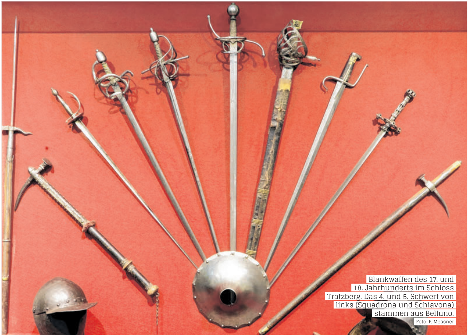
Blankwaffen des 17. und 18. Jahrhunderts im Schloss Tratzberg. Das 4. und 5. Schwert von links (Squadrona und Schiavona) stammen aus Belluno.

Hochburg der Waffenschmiedekunst wurde. Im Forschungsprojekt soll der Weg des Eisens vom Erz bis zum fertigen Schwert im Gebiet der ehemaligen Grafschaft Tirol nachgezeichnet und mittels moderner Technologien zugänglich gemacht werden. „Die ehemalige Gefürstete Grafschaft Tirol erstreckte sich vom Gardasee bis nach Kufstein und um-