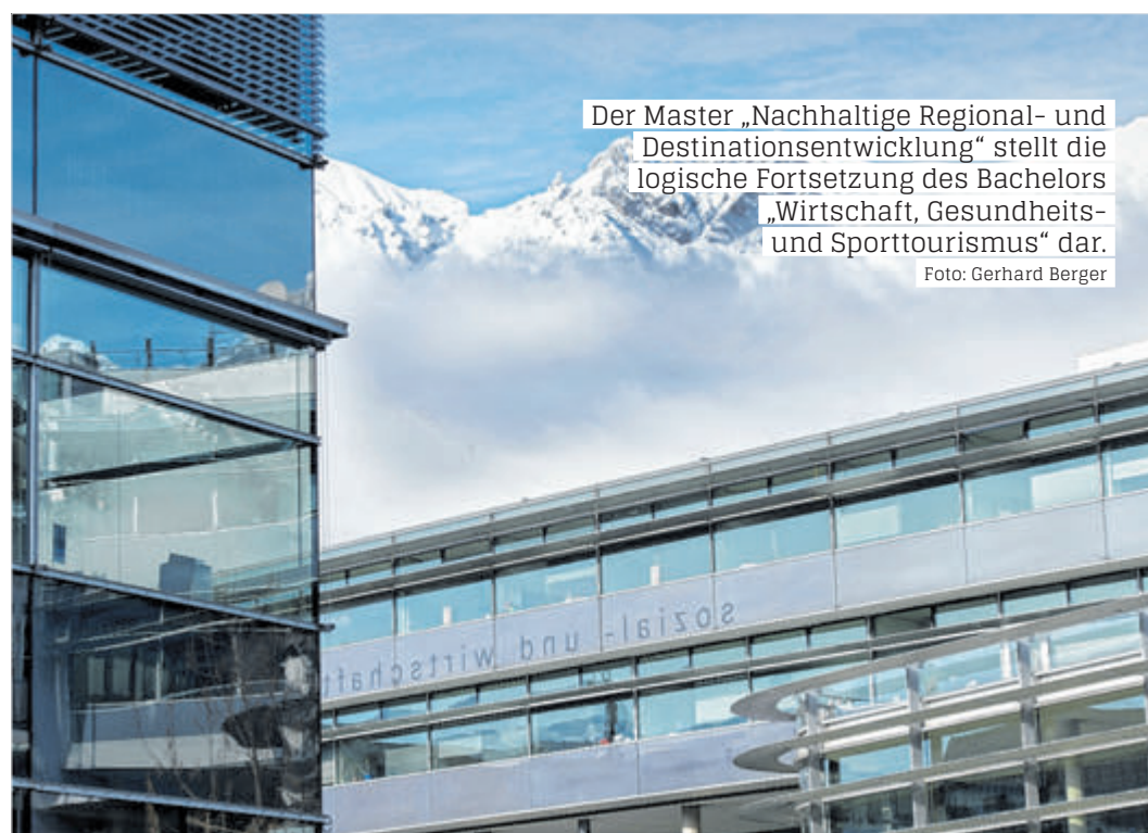
Der Master „Nachhaltige Regional- und Destinationsentwicklung“ stellt die logische Fortsetzung des Bachelors „Wirtschaft, Gesundheits- und Sporttourismus“ dar.