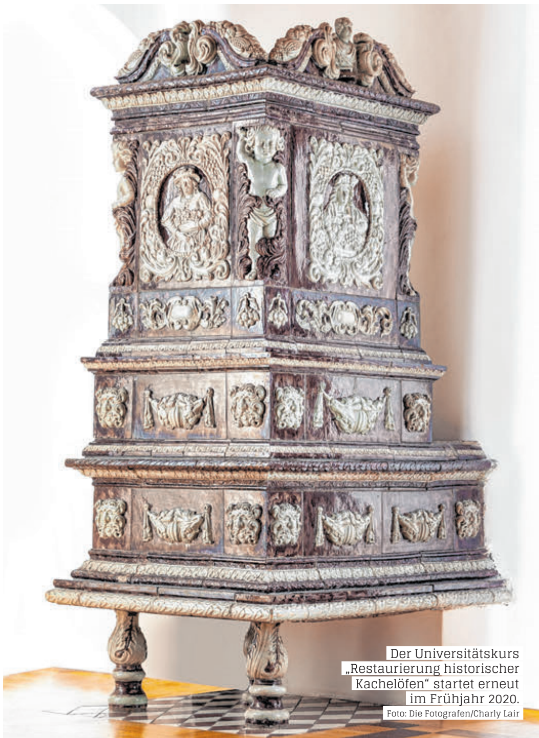
Der Universitätskurs „Restaurierung historischer Kachelöfen“ startet erneut im Frühjahr 2020.