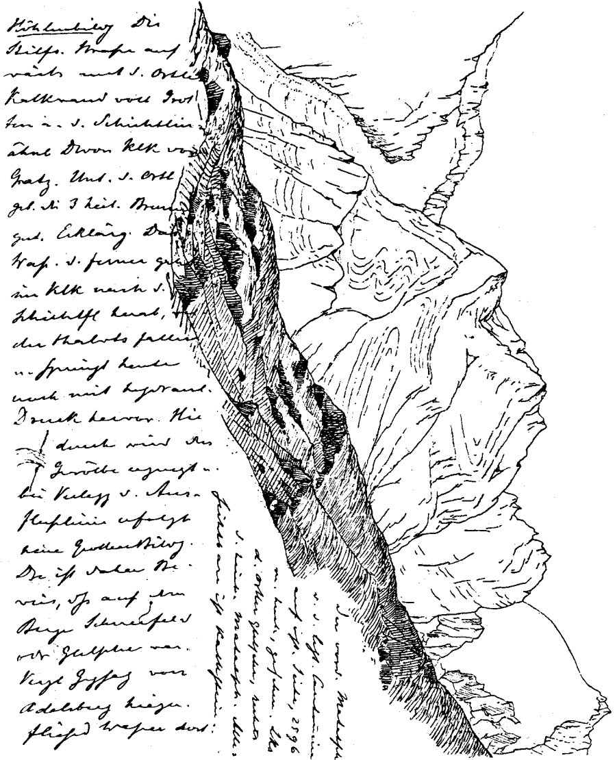
Abb. 4: Skizze des Faltenbaues im Ortlergebiet aus dem Kartierungsheft Nr. 4 von Eduard SUESS vom 28. August 1875 als Beispiel für seine Zeichentechnik tektonischer Strukturen.