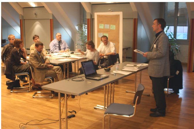
Diskusija o inštrumentih z regionalnimi deležniki v Traunsteinu (Nemčija)

interese in potrebe različnih skupin déležnikov.