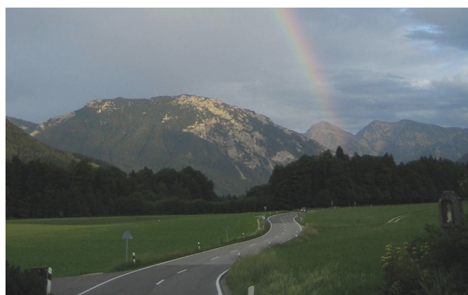
Pot do sonaravnega upravljanja z zemljiškimi viri je dolga in ovinkasta...

Upravljanje z zemljiškimi viri se zdaj sooča z novimi izzivi, še zlasti na območju Alp, kar bo še povečalo že obstoječe konflikte. Potrebe po prilagajanju podnebnim spremembam bodo pripeljale do nadaljnjih omejitev razpoložljivih površin za razvoj naselij in infrastrukture, demografske spremembe bodo postavile nove predpogoje za povpraševanje po zemljiščih in nove perspektive za kmetijstvo, prav tako lahko ruralna območja zaostrijo konflikte med naselji, infrastrukturo, kmetijstvom in gozdarstvom glede zemljiške izrabe. Nenehna optimizacija orodij in inštrumentov za upravljanje z zemljiškimi viri zato ostaja še naprej osrednja naloga in izziv v razvoju Alp.