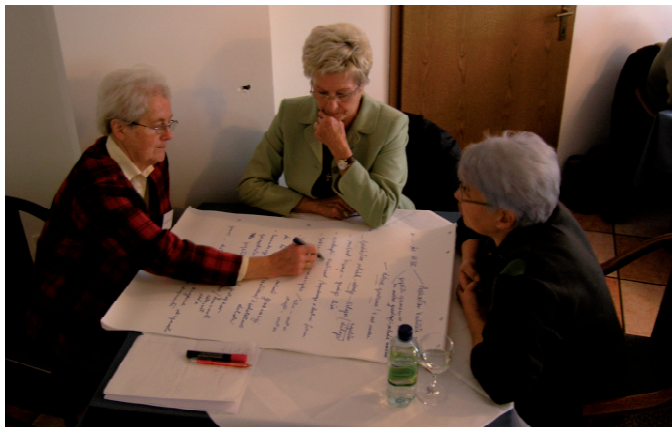
Il primo workshop a Idrija

Nei seguenti dialoghi si può integrare un nuovo argomento o approfondire maggiormente il primo. Al termine di tre o più conversazioni l'intero gruppo si riunisce per presentare gli argomenti emersi, le opinioni e i risultati che vengono scritti su lavagne o altro, al fine di rendere accessibili a tutti le conoscenze collettive. In questo modo si ha una panoramica di quanto è stato detto complessivamente. A questo punto l'incontro può essere concluso oppure si procede con i dialoghi per analizzare altri temi.