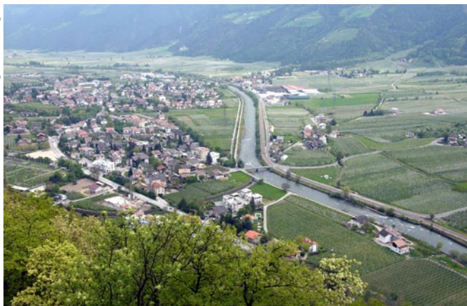
Hohe Lebensqualität: eine große Chance für den Alpenraum (Blick auf das Etschtal im Vinschgau).