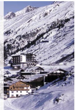
Abb. 1: Die Umfrage identifizierte acht „Schlüsselthemen“ alpiner Entwicklung.

Verkehrsbelastungen; Marginalisierung peripherer ländlicher Räume; Urbanisierungsprozesse; Nachhaltigkeit im Tourismus; Innovation und konkurrenzfähige Wirtschaftsaktivitäten; Auswirkungen des Klimawandels; Erhaltung der Wälder im Alpenraum; Erhalt und Entwicklung natürlicher und kultureller Ressourcen