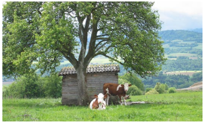
Die Fortdauer eines idyllischen Bildes von den Alpen...

Um die Antworten vergleichen zu können, mussten wir außerdem die Faktoren berücksichtigen, die die Expertenmeinung beeinflussen. Verschiedene Kriterien könnten die Unterschiede erklären: das Profil der Experten (Wissenschaftler oder Interessensvertreter), ihre Nationalität