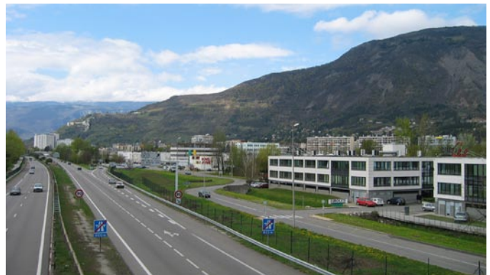
... im Konflikt mit der weniger romantischen Realität.

oder der Grad ihrer Kompetenz. Zudem antworteten einige Experten nur für ihre Region oder ihr Land und erklärten, dass sie sich nicht in der Lage sehen, den gesamten Alpenraum zu beurteilen. Andere analysierten die derzeitige Situation und legten klar, dass sie keine feste Meinung zu der zukünftigen Entwicklung haben. Betrachtet man nun alle diese Faktoren, so tritt keine allgemeine Schlussfolgerung zu Tage: in manchen Fällen spielten diese Kriterien offensichtlich eine Rolle in anderen war dies weniger wahrnehmbar. Aus diesen Gründen betrachteten wir Divergenzen in den Meinungen eher als Ergebnis unterschiedlicher Sensibilität und weniger als Folge objektiver Faktoren. Für uns ist das ein Zeichen der Komplexität der Themen und des Fehlens eines „einheitlichen Denkens“ darüber.